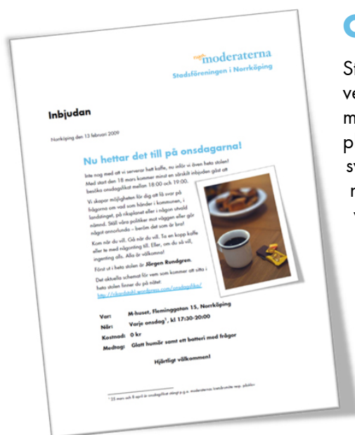
Stadsföreningens uppskattade onsdagsfika vidareutvecklas under våren 2009.